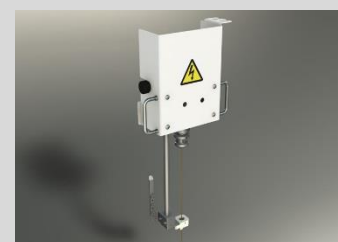
簡易スタートホール加工