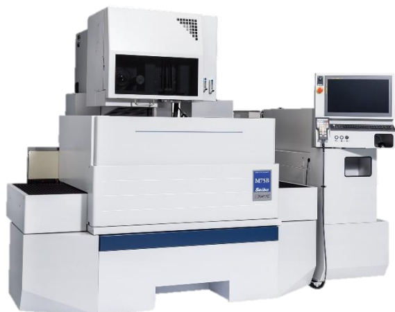
大型精密ワイヤ放電加工機 M75B